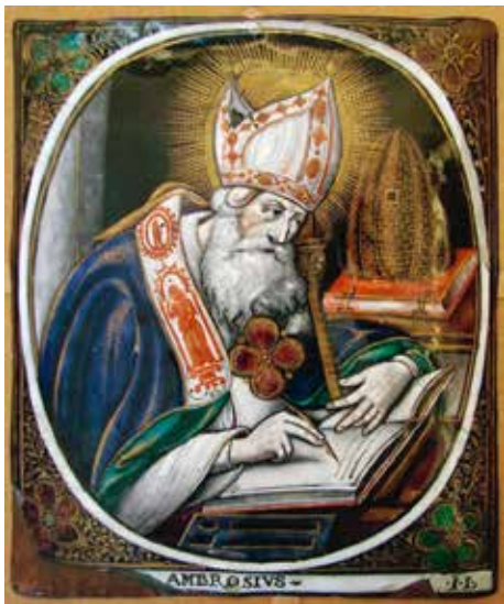
Patronem včelařů je sv. Ambrož, zpravidla znázorňovaný se svým atributem – včelím úlem

Dnešní putování za zajímavými osobnostmi, které se nějak dotkly hostivařské minulosti, nás zavede za panem farářem Josefem Antonínem Janišem. Jeho podobizna se sice nedochovala, ale nejenže působil jako kněz v našem kostele Stětí svatého Jana Křtitele, ale právě tady také sepsal jedno z nejzásadnějších děl o životě a chovu včel. A to nejen na české, ale i světové úrovni.