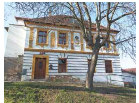
Chalupnická ulice čp. 39, Hostivař