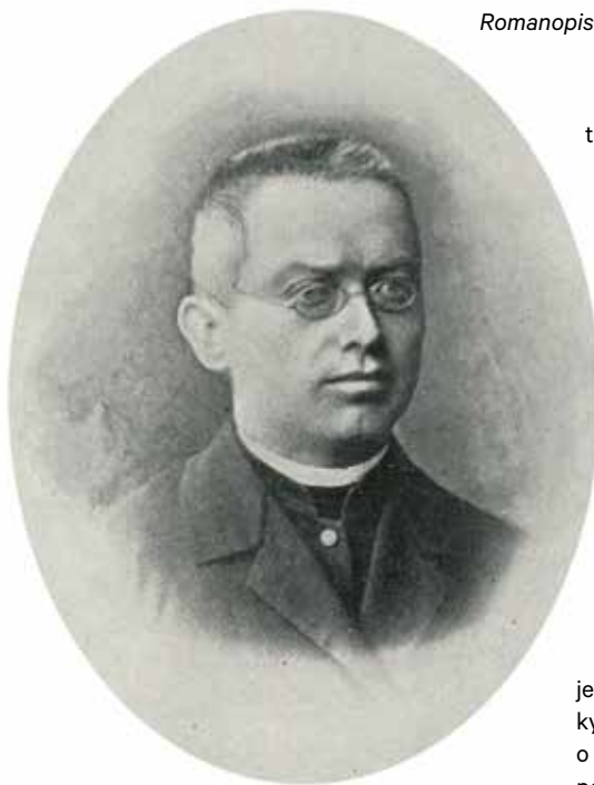
Romanopisec, kterého miloval celý národ