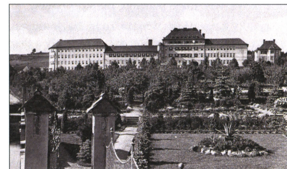
Budova nové školy ve Velkém Meziříčí