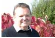
ŽIJÍ MEZI NÁMI FILMOVÝ PRODUCENT OLDŘICH MACH