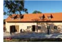
KOMUNITNÍ CENTRUM FARNÍ DVŮR OTEVÍRÁ SVÉ BRÁNY